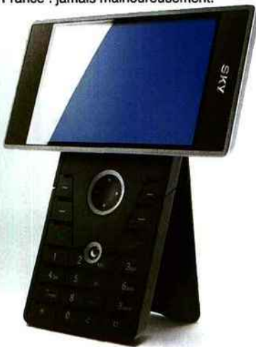
■ Design hallucinant pour ce modèle Pantech, le Transformer.

Le constructeur coréen Pantech vient de remporter pour la seconde année consécutive l'IF Design Awards for Excellence & Innovation. Comme son nom l'indique, ce prix récompense les meilleures innovations en terme de Design. Son modèle, le Transformer (c'est son nom), a été conçu pour regarder la télévision au format paysage, grâce à son écran pivotant. Date d'arrivée en France : jamais malheureusement.