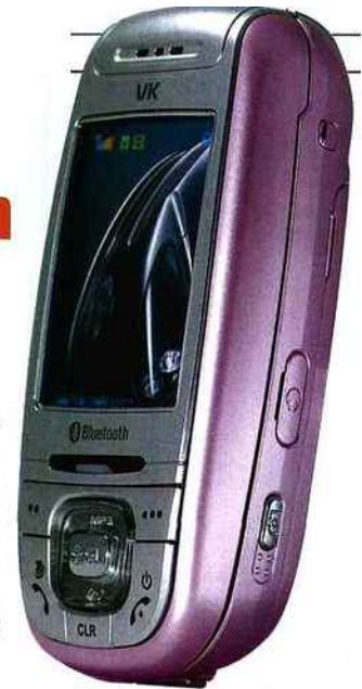
■ Le VK4000 est disponible en noir pour les plus sérieux.

Très fortement inspiré du slider vedette de Samsung, le VK4000 est très compact pour un poids de 80 grammes. Sa couleur rose bonbon nacré était jusque là réservée à l'Asie, mais elle commence à plaire en Europe. La finition est soignée et le slide coulisse à merveille. Doté d'un lecteur MP3, le VK4000 a la bonne idée d'embarquer un port microSD, qui boostera ses 64 Mo. Quadri bande, il fera un excellent compagnon de voyages. Seul point négatif au tableau, l'appareil photo qui se contente d'une résolution de 0,3 million de pixels.