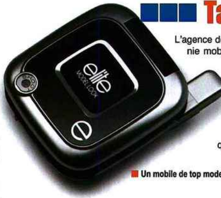
■ Un mobile de top model, taille mannequin

L'agence de mannequin Elite se lance dans la téléphonie mobile. Forte d'un partenariat avec Modelabs, un clamshell miniature au look très élégant sortira à son nom. Le gabarit est semblable à celui du Air99, réalisé par le même fabricant pour Airness. Son originalité réside dans la présence d'un mannequin virtuelle dans le téléphone, à habiller selon ses envies. De quoi se prendre pour un styliste !